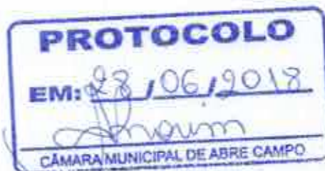
Vereador Wantuil Sampaio Viana